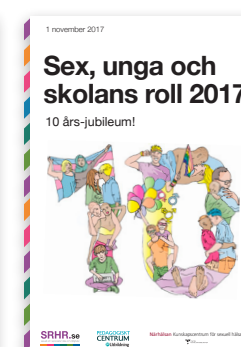
2017: 10 års-jubileum!