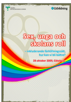
2009: Inkluderande förhållningssätt