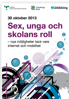
2013: Nyamöjligheter tack vare internet och mobilitet