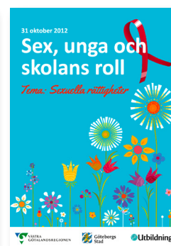
2012: Sexuella rättigheter