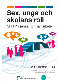
2014: SRHR i samtal och samarbete