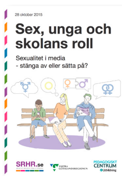
2015: Sexualitet i media - stänga av eller sätta på?