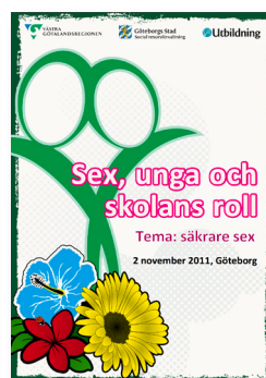
2011: Säkrare sex