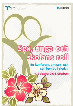
2008: Sex- och samlevnad i skolan

Tillbakablick på tidigare års program och teman: