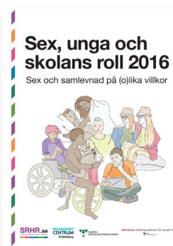
2016: Sex och samlevnad på (o)lika villkor