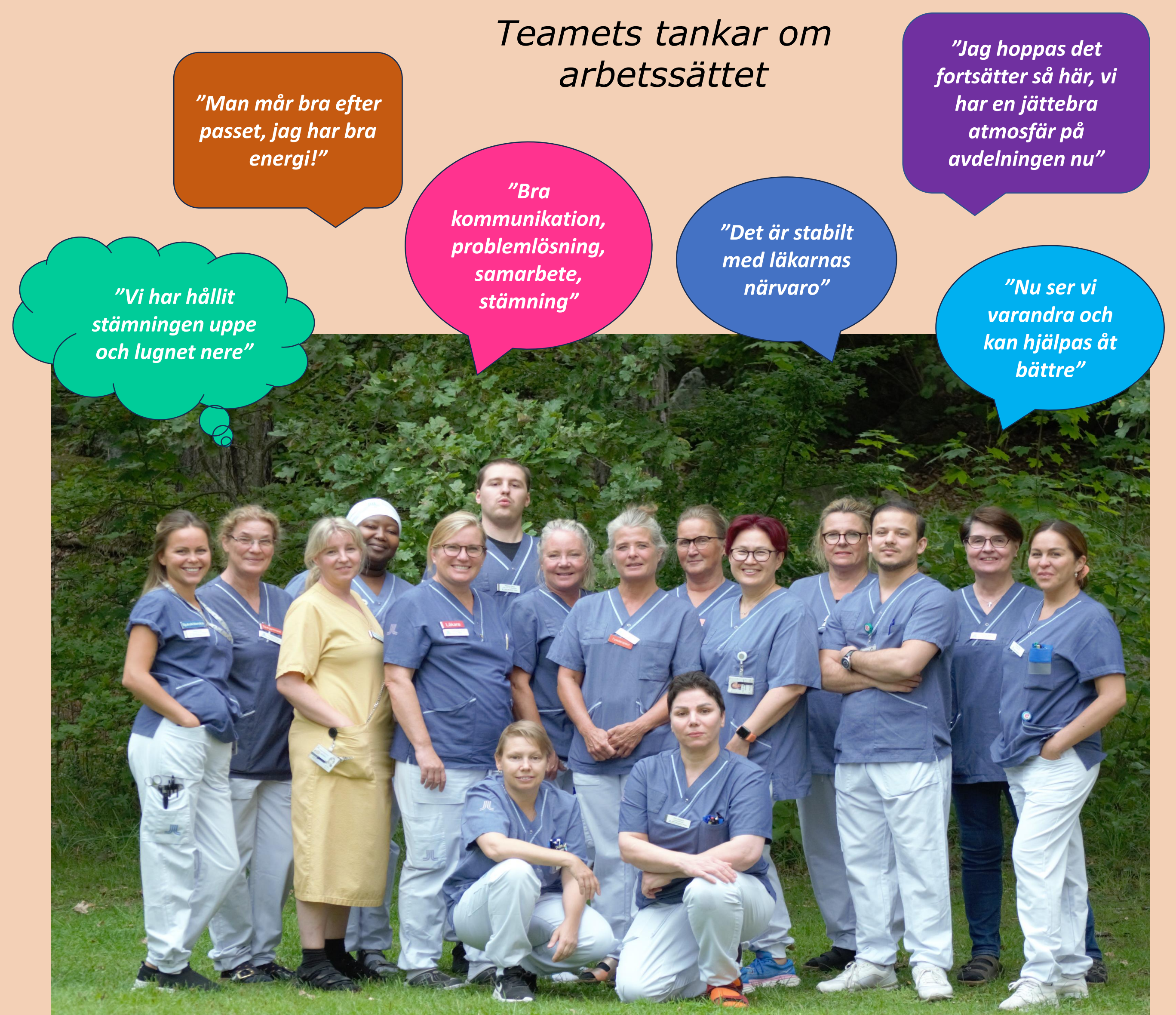
En del av vårt multiprofessionella team på den specialiserade palliativa vårdavdelningen, Långbro Park