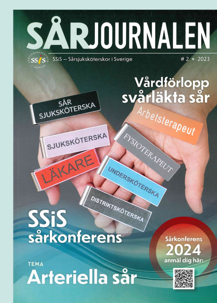
Sårjournalen nr 2, 2023 uppmärksammar vikten av ett multiprofessionellt sårteam.

Trycksår är en vanligt förekommande vårdskada. Kunskapen om trycksår inom vården är fortfarande låg nationellt. Chefer och ledningen inom sjukvården har en viktig roll för att personalen ska kunna arbeta patientsäkert. De behöver ge personalen förutsättningar att uppdatera sin kunskap och ha tillgång till rätt material för att kunna förebygga/läka trycksår.