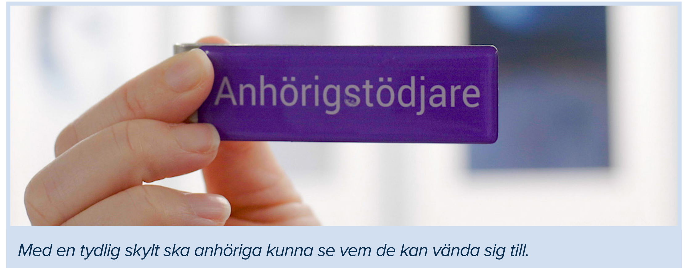
Med en tydlig skylt ska anhöriga kunna se vem de kan vända sig till.

Visionen är att alla anhöriga ska känna sig delaktiga och trygga med vetskap om att de är viktiga, både för patienten och personalen.